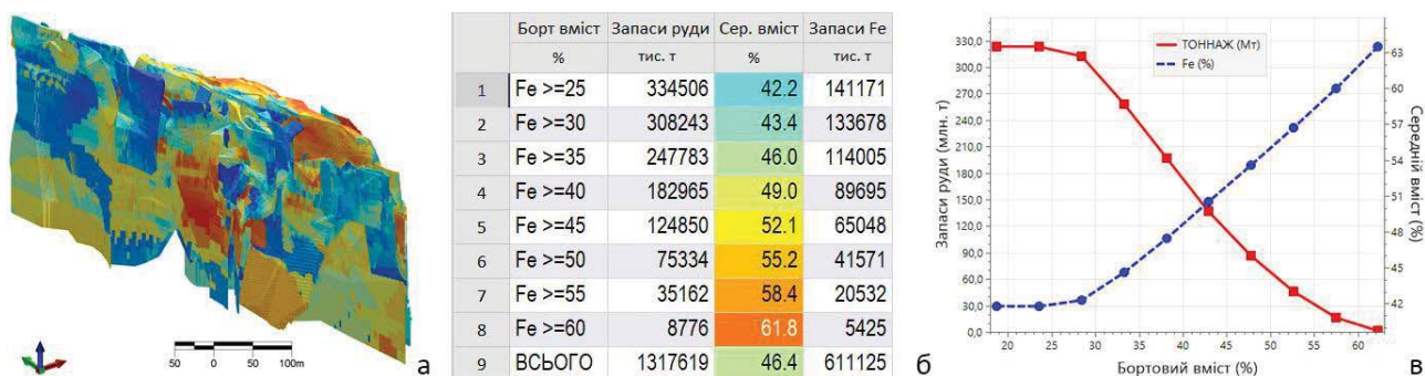
Рис. 1. Блокова модель – а, звіт щодо підрахунку запасів (оцінки ресурсів) – б, крива вміст-тоннаж – в

такі вимоги є більш загальними і менш детальними, що в цілому є характерним для міжнародних вимог. Деякі аспекти, що стосуються, наприклад, ураганних (екстремально високих) вмістів, обґрунтування методів підрахунку та ін., є дуже подібними. Інші, зокрема щодо параметрів моделювання або кондицій, суттєво відрізняються, що обумовлено відмінністю підходів. Так, результатом оцінки мінеральних ресурсів зазвичай є ресурсна модель, обмежена літологією або природним (статистичним) бортовим вмістом, а також “побортовим” звітом щодо ресурсів. Обґрунтування параметрів кондицій та переведення ресурсів в запаси відбувається на наступному етапі техніко-економічної оцінки (Pre/Feasibility Study), тому вони не включені у критерії оцінки ресурсів.